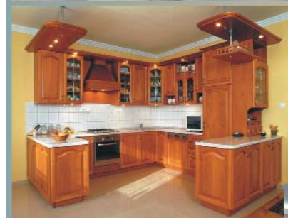
Stone Line a kő nyomdokain... modern formák legújabb technika

Idegen tollakkal? Mi a sajátunkat hirdetjük!