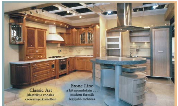
Classic Art klasszikus vonalak cseresznye kivitelben

Tisztelje meg a kultúra kis szigetét látogatásával!