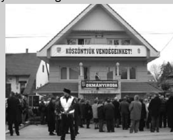
Március 14-én ünnepélyesen átadták az új gödi okmányirodát és rendőrörsöt