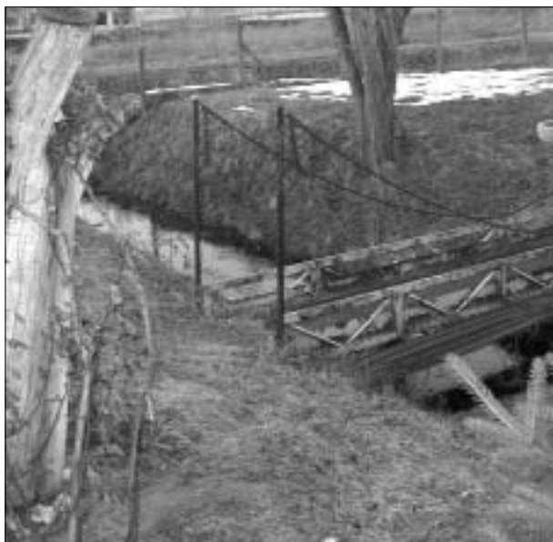
A kerten keresztül folyó Tece patak adta a vendéglő elnevezéséhez is az ötletet.

tulajdonosó így válaszolt: „mivel a Tece patak a kertünkön folyik keresztül, - ez adta egyébként a vendéglő elnevezéséhez is az ötletet, - úgy gondoltuk, hogy a patak partján egy kis hangulatos kerthelyiséget alakítunk ki a későbbiek során. Ezzel is növelve a söröző színvonalát, a vendégek kényelmét. Ehhez az elképzelésünkhöz az előkészületeket már a tavalyi évben elkezdtük, rendbe hoztuk a patak partját, nagyfiam nekilátott egy sziklakert tervezésének. Ezek mind a kerthelyiségbe majdan betérő vendégek kényelmét hivatottak szolgálni. Remélem, hogy a kerthelyiség tavasztól őszig vonzani fogja az erre a környékre betelepülő lakókat is. Éppen ezért nekem is az az érdekem, hogy Sződöt minél több ember érezze magáénak, minél többen maradjanak itt a fiatalok közül is, a nyugalmas, és egészséges környezetben.”