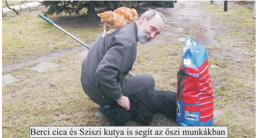
Berci cica és Sziszi kutya is segít az őszi munkákban