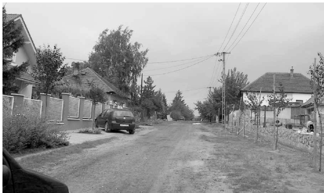
„Por és hamu” ... új út a Mária utcának a Kolozsvári utca felőli végén